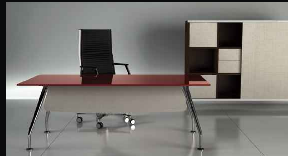
Nexis, raffinata e innovativa con piani di lavoro in cristallo.