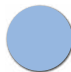
CARTA DA ZUCCHERO